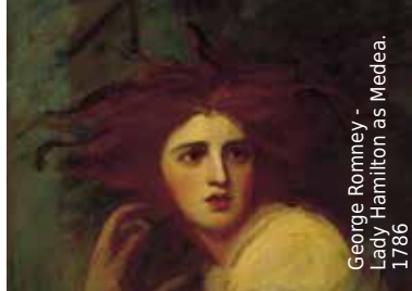
George Romney - Lady Hamilton as Medea. 1786