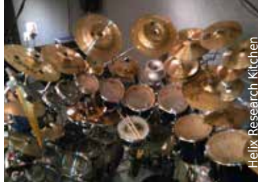
Helix Research Kitchen